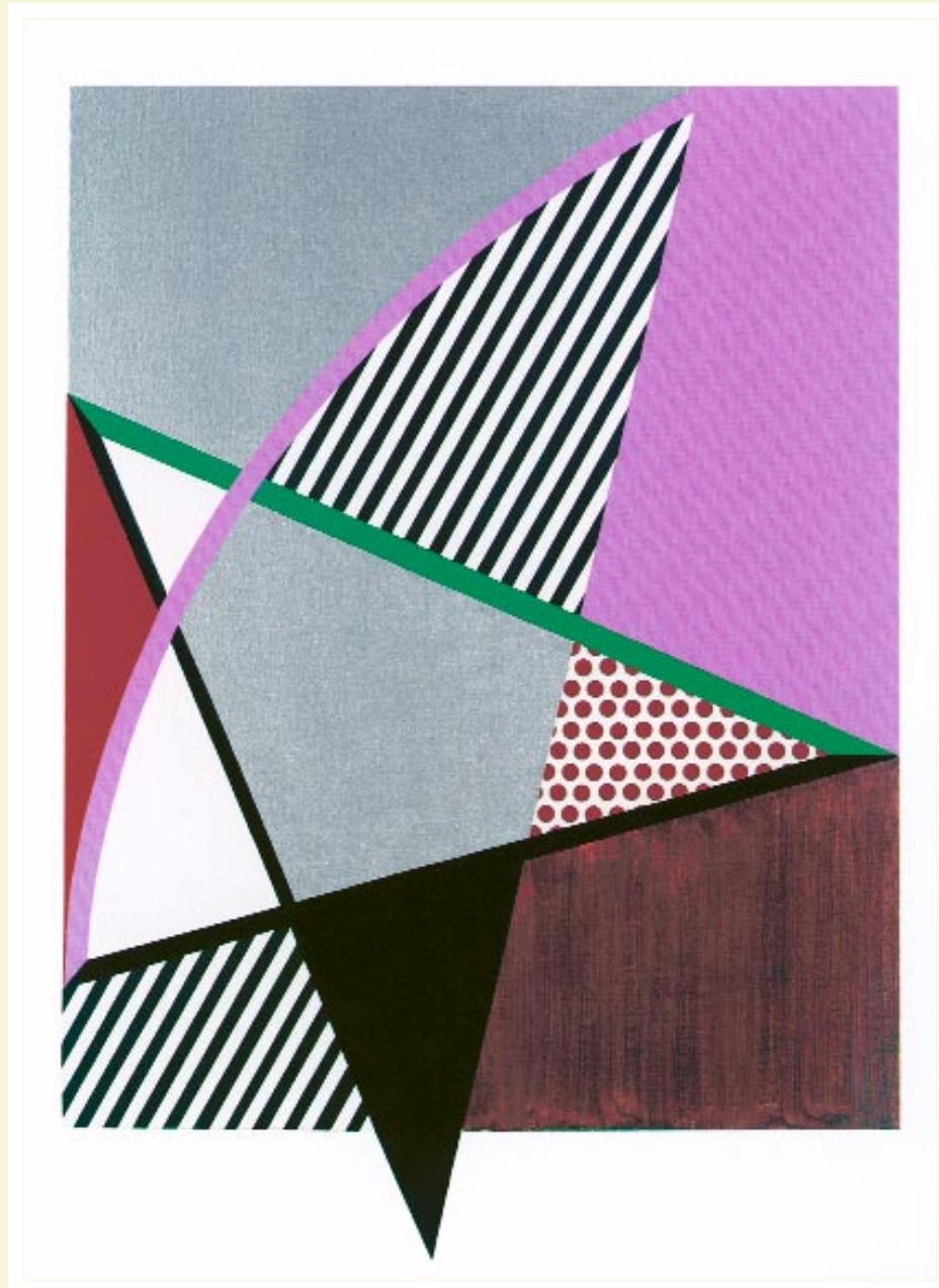
Roy Lichtenstein, Imperfect Painting, 1987, Magna und Öl auf Leinwand