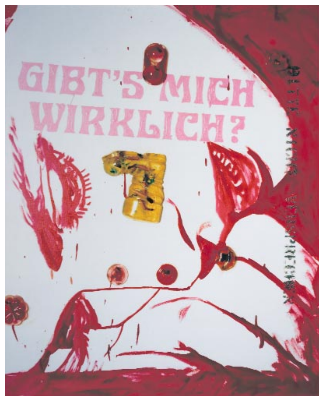
Martin Kippenberger, Ohne Titel (no. 13), 1989–90, Farbfotografie