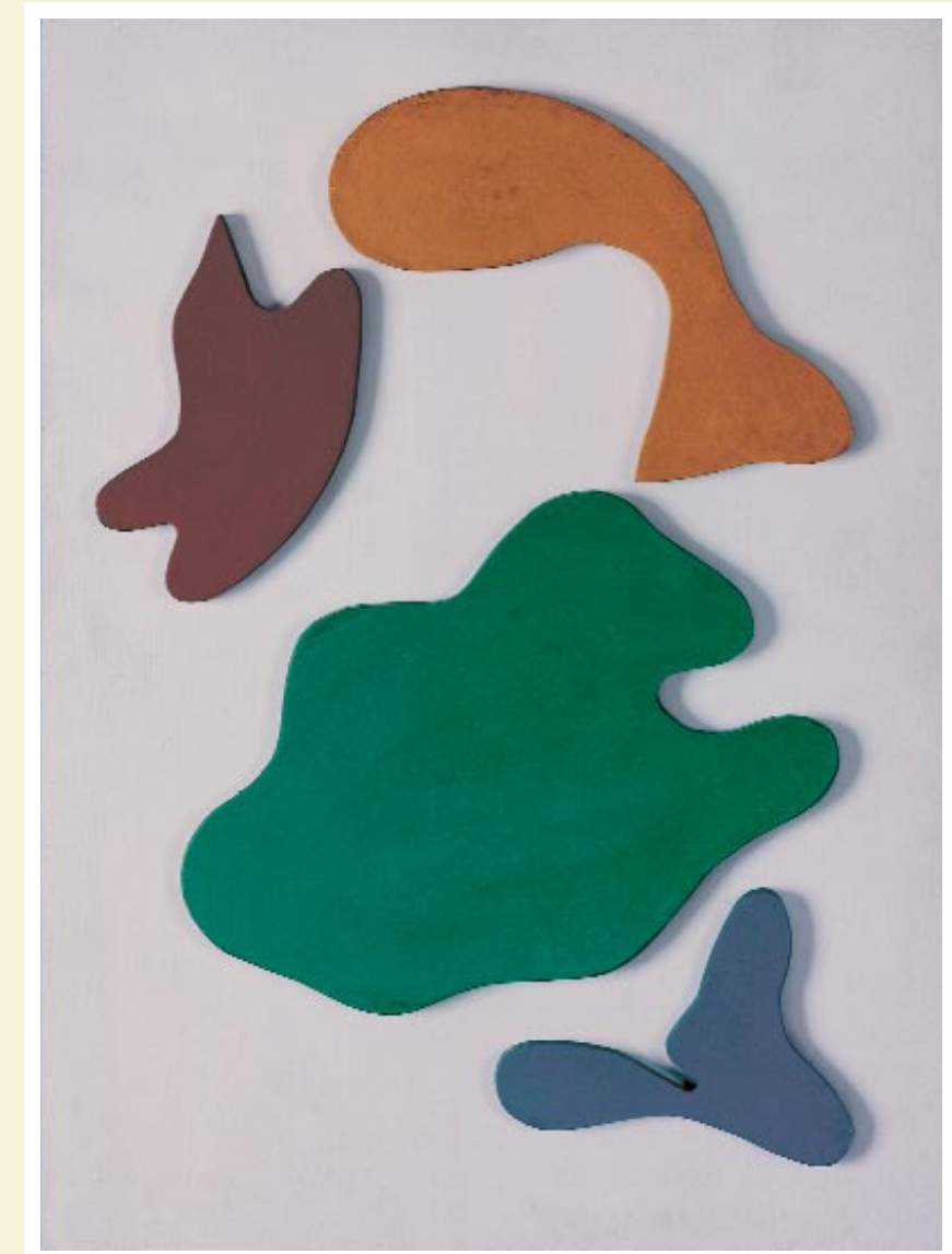
Hans (Jean) Arp, Konstellation Fribourg, 1965, Holz, bemalt

DANEBEN UNTERSTÜTZT SAL. OPPENHEIM DIE MUSIKTRIENNALE, DIE IM APRIL 2004 ZUM VIERTEN MAL IN KÖLN STATTFAND, ALS EINER IHRER HAUPTSPONSOREN. DANK DIESER UNTERSTÜTZUNG WAR ES MÖGLICH, MIT DEM RUSSISCHEN NATIONALORCHESTER UNTER DER LEITUNG VON MIKHAIL PLETNEV EIN INTERNATIONALES SPITZENENSEMBLE ZU ENGAGIEREN.