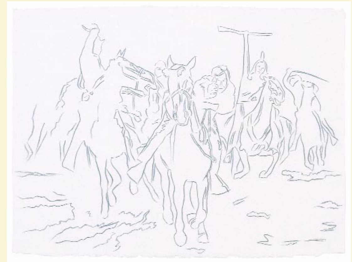
Andy Warhol, Cowboys & Indians: Action Picture, 1986, Graphit auf Papier

ZU EHREN SEINES VATERS UND ZUR ERFORSCHUNG DER URSACHEN VON RASSISMUS, ANTISEMITISMUS UND DES HOLOCAUSTS LIESS ALFRED FREIHERR VON OPPENHEIM 1997 AN DER GEDENK- UND FORSCHUNGSTÄTTE YAD VASHEM IN JERUSALEM EINEN „FRIEDRICH CARL FREIHERR VON OPPENHEIM-LEHRSTUHL“ EINRICHTEN.