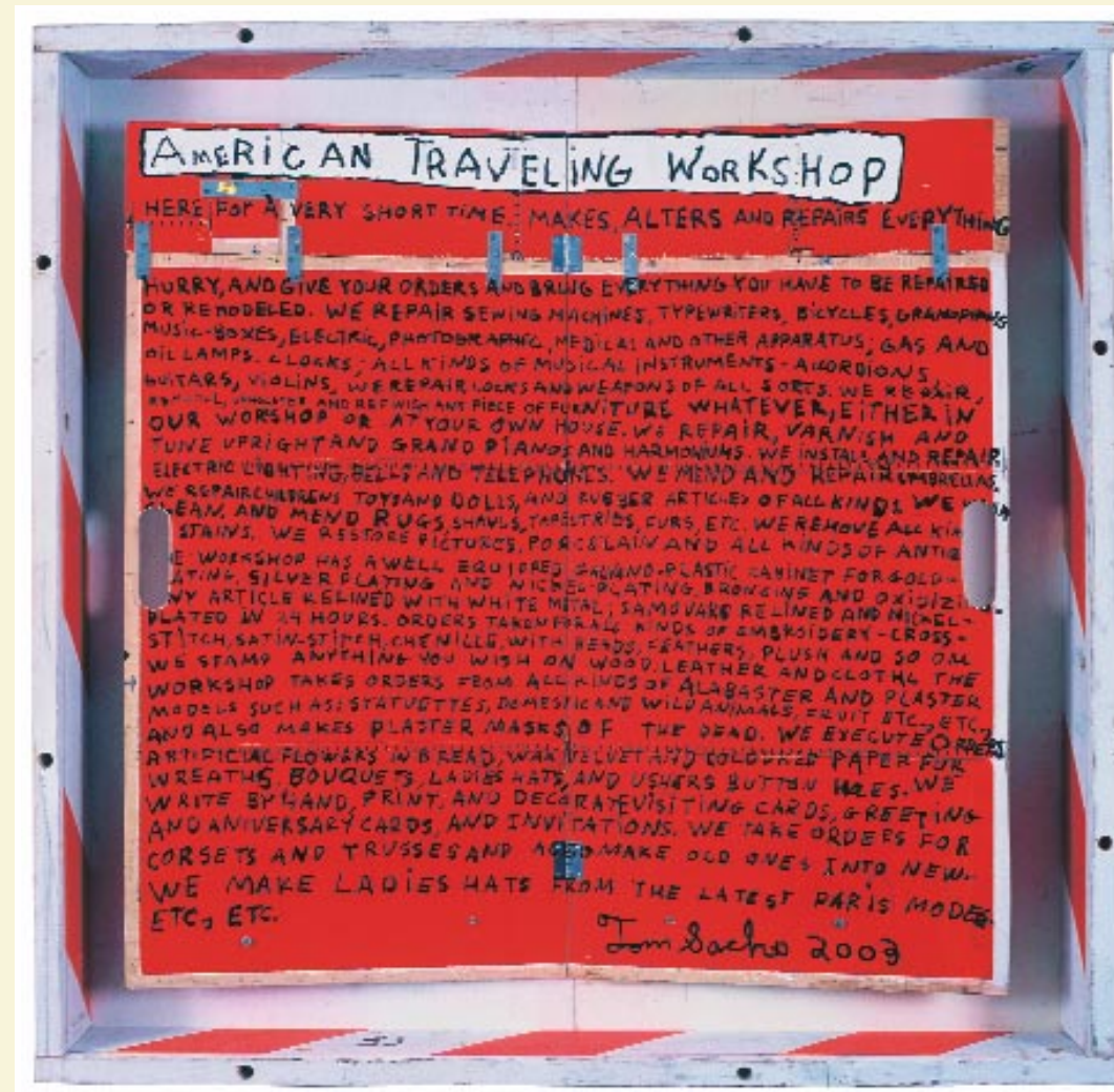
Tom Sachs, American Traveling Workshop, 2003, Öl und Latex auf Sperrholz, Pinienholz, Eisenwaren, Glasstaub

ZU BEGINN DES 19. JAHRHUNDERTS SETZTE SICH DIE FAMILIE OPPENHEIM FÜR DIE VERBESSERUNG DER UNTERRICHTSBEDINGUNGEN AN DEN JÜDISCHEN ELEMENTARSCHULEN EIN. GELDMITTEL, SCHULMATERIAL, ABER AUCH RÄUME WAREN MANGELWARE IM ÖFFENTLICHEN SCHULBETRIEB UND WURDEN IN VIELEN FÄLLEN PRIVAT BEREITGESTELLT.